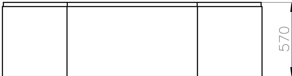
Ansicht von vorn